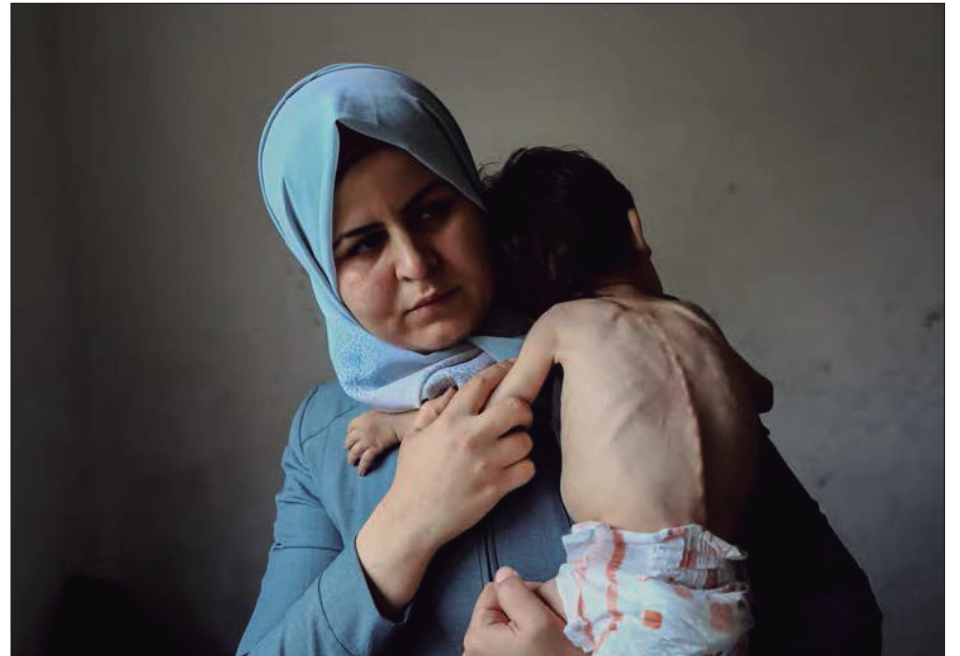
Una madre y su hijo de tres años con desnutrición en el campamento de Jabalia, Norte de Gaza, el 9 de junio

[...] Según Unicef, desde octubre de 2023, han muerto 37.266 personas, 14.100 de ellas niños y 9.000 mujeres.