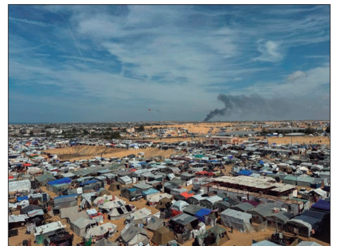
Campamento en Rafah bombardeado