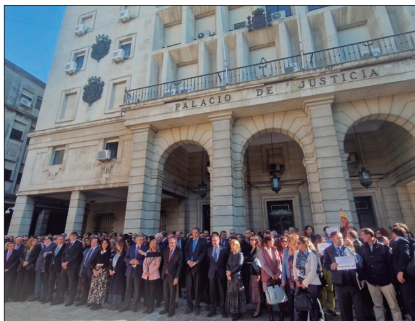
Concentración de jueces contra la Ley de Amnistía en Sevilla ante el Palacio de Justicia