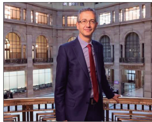
Pablo Hernández de Cos, exgobernador del Banco de España, recientemente cesado por fin de mandato

Llegamos al extremo de que esa especial «justicia europea» disputa a los tribunales espa-