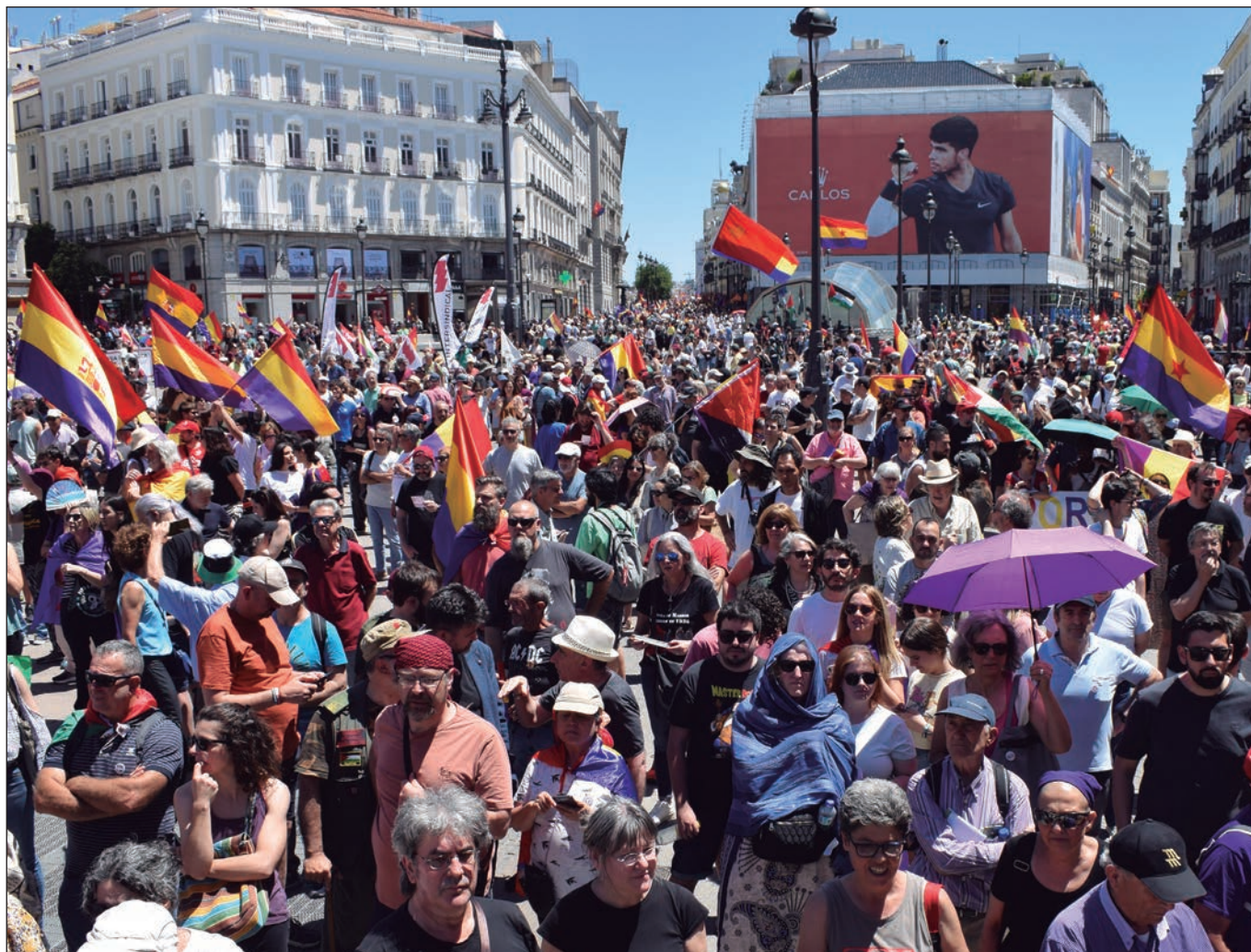
Marcha por la República: 16 de junio en la Puerta del Sol de Madrid