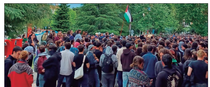
Ocupación Vicerrectorado Universidad Complutense

[...] La acampada genera un gran desgaste entre las personas que participan en ella. Noches incómodas, los diferentes turnos a cubrir para mantener el espacio limpio o poder hacer la comida, la necesidad de conseguir donaciones para mantener el funcionamiento de la misma. Todo esto de forma paralela a las diferentes acciones de reivindicación y protesta para avanzar en nuestros objetivos. Al cansancio acumulado hay que unirle que nos encontrábamos en periodo de exámenes frente a lo que las campistas tuvie-