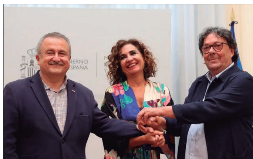
María Jesús Montero, vicepresidenta del Gobierno y los responsables de CC00 y UGT de la Función Pública