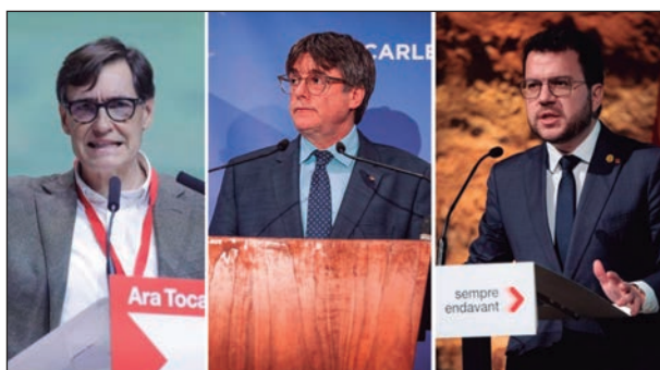
Salvador Illa, Carles Puigdemont y Pere Aragones

Llegados a este punto, forzoso es señalar que lo que se está planteando por unos y otros nos remite a 2011, cuando Artur Mas fue a Madrid a plantear a Rajoy una mejora de la financiación. Es decir, nos remite al marco autonómico, el del Estado de las Autonomías, que bajo el manto de unos Parlamentos autonómicos que no tienen realmente soberanía para decidir, aboca inevitablemente a la pugna interautonómica, al enfrentamiento entre comunidades.